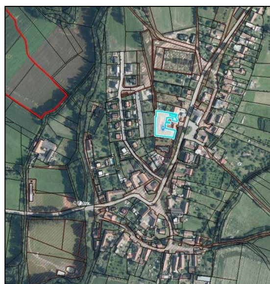
Plocha Jedlé zahrady