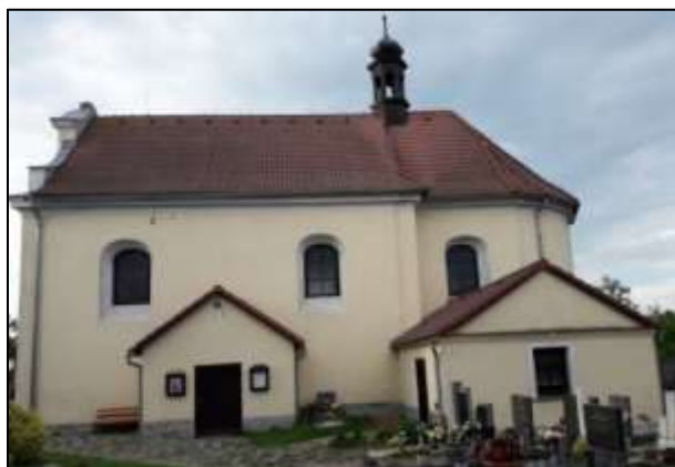
Kostel sv. Vavřince