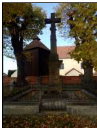
Krucifix u hřbitova